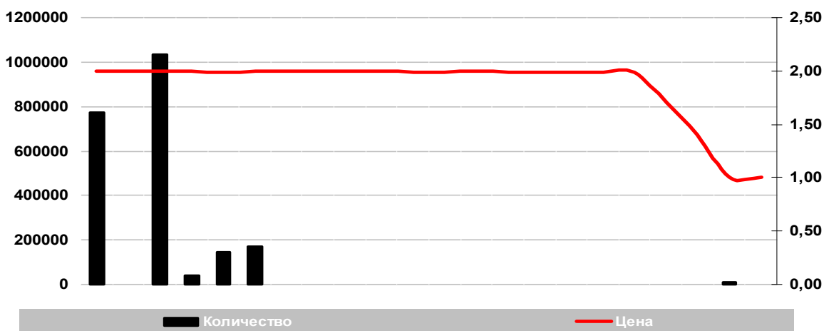
Движение на цената на акциите на СПАРКИ АД за периода от 01.01.2016 г. до 31.12.2016 г.