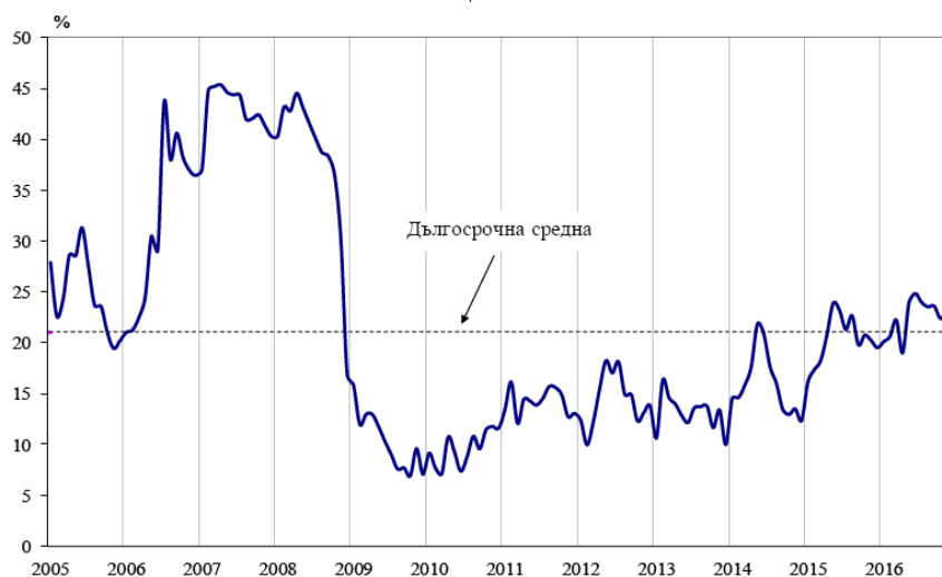
Фиг. 1. Бизнес климат - общо

По данни на НСИ през декември 2016 г. общият показател на бизнес климата остава на нивото си от предходния месец. Подобрене на стопанската конюнктура се регистрира в промишлеността и строителството, докато в търговията на дребно и сектора на услугите се отчита понижение.